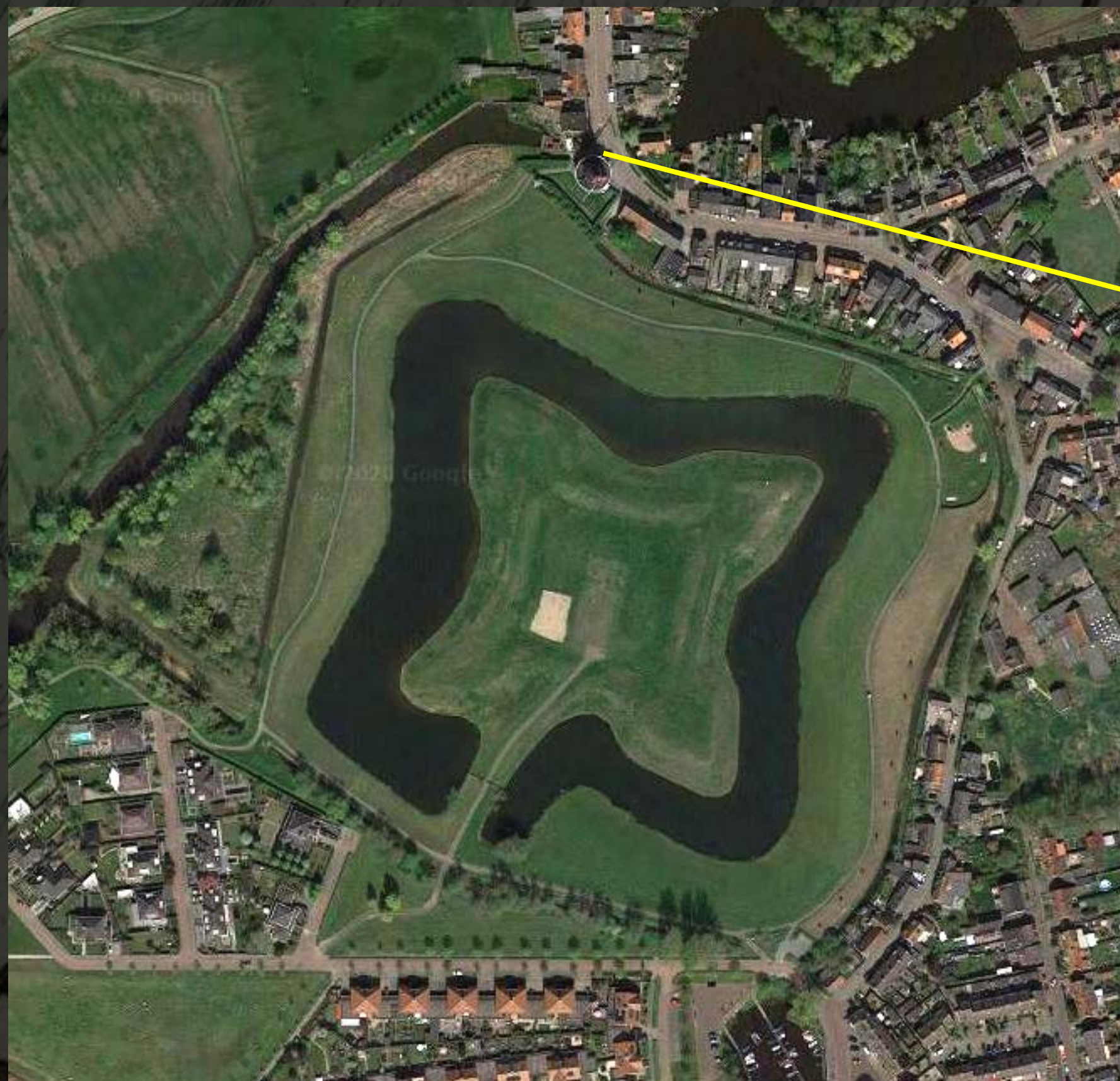
Molen de Arend