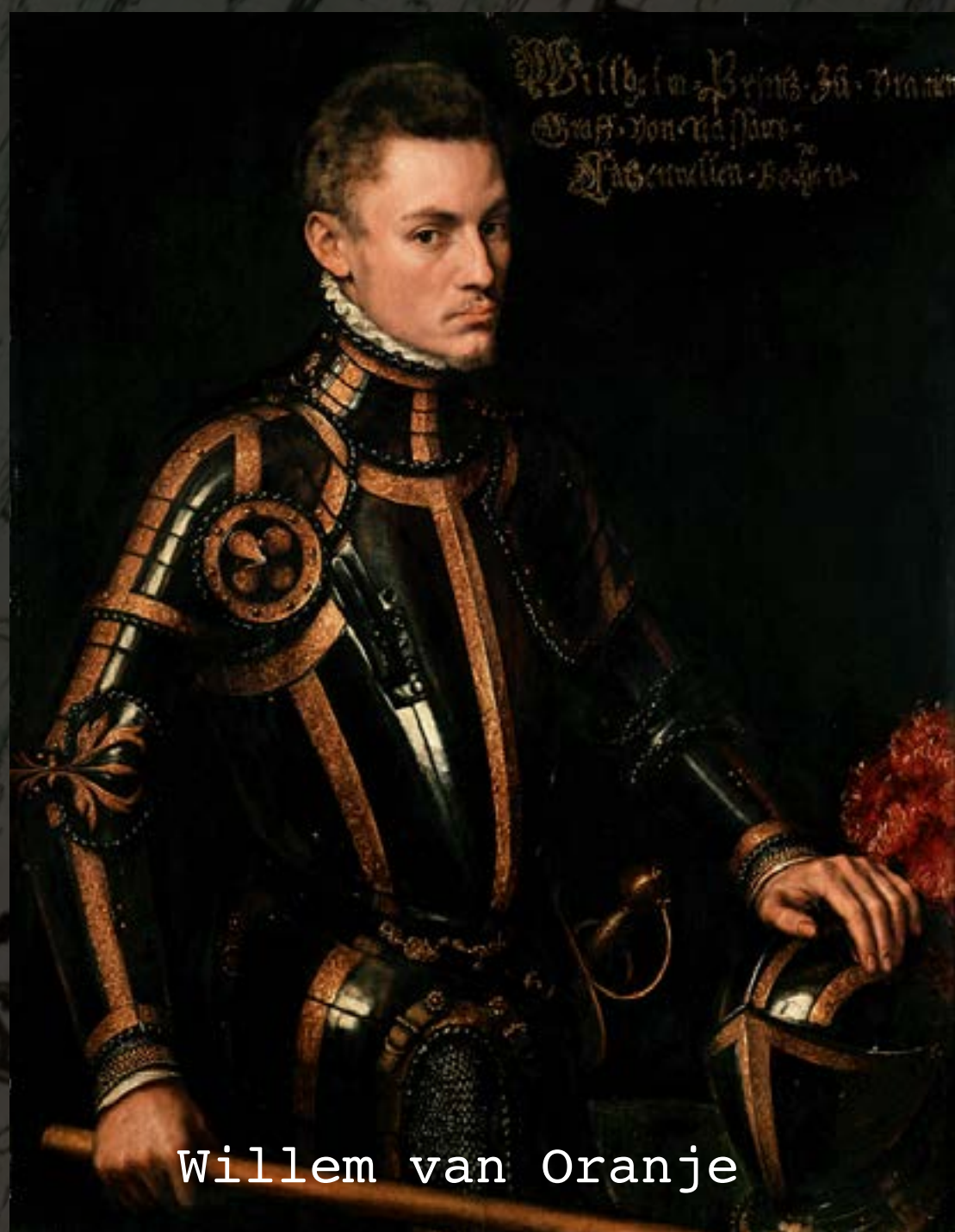
Willem van Oranje

De strijd tussen de protestantse Staatse troepen uit Holland en het katholieke Spaanse leger kent vele wendingen. De stad Breda wisselde in die tachtig jaar maar liefst zes keer van overheerser. Dat waren de Staatsen of protestanten onder aanvoering van stadhouder Willem van Oranje. Of de gevreesde Spanjaarden (Paaps of katholiek) onder aanvoering van Koning Filips II.